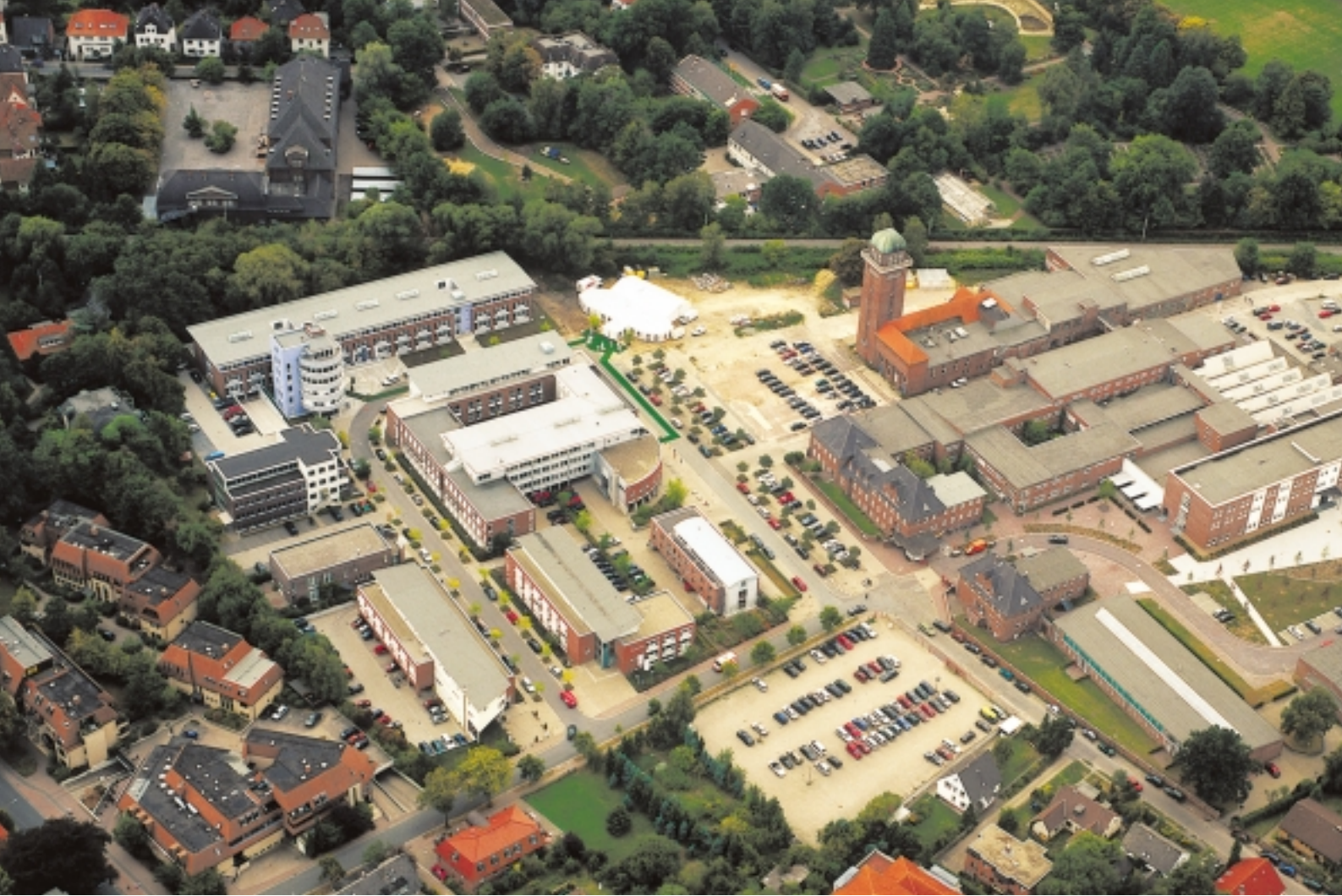
Oben: Das Oldenburger IT-Zentrum rund um den Turm der Alten Oldenburger Fleischwarenfabrik (oben rechts) wächst stetig.

Above: Oldenburg's IT Center, constructed around the previous water tower of the Old Oldenburg Meat Factory (top right), is constantly growing.