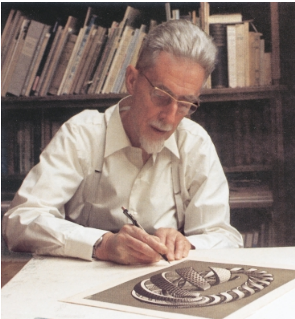
Escher* in seinem Studio in Baarn signiert den Druck „Spiralen“, 1970.