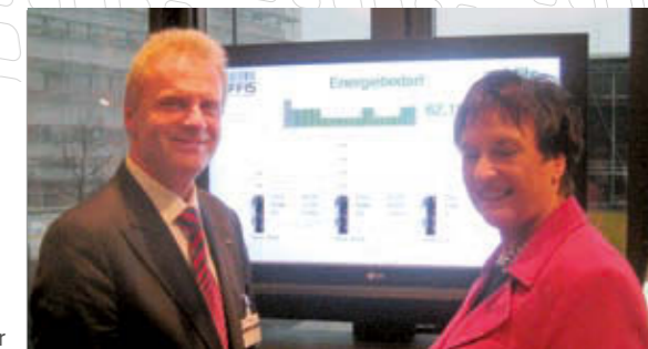
Im Gespräch auf dem Gipfel: Prof. Nebel mit Bundesjustizministerin Brigitte Zypries

OFFIS entwickelt neue dynamisch adaptive Verfahren mit deren Hilfe die zum jeweiligen Zeitpunkt benötigte Rechen- oder Kommunikationsleistung auf eine möglichst kleine Anzahl von Rechnern oder Netzwerkkomponenten konzentriert werden kann, damit die anderen Ressourcen abgeschaltet und nur für Spitzenlasten vorgehalten werden können. Mit Unterstützung des Systemhaus iits aus Oldenburg wurde prototypisch ein solch dynamisches Verfahren entwickelt und auf